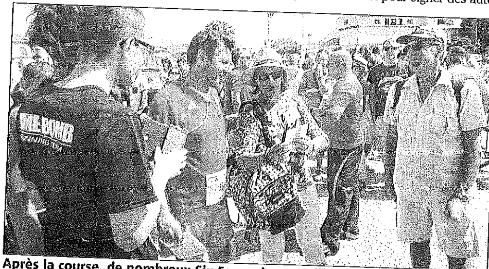
Après la course, de nombreux Six-Fournais ont sollicité le maire de Nice pour des photos avec lui.

pants pour une séance photos et pour signer des auto-